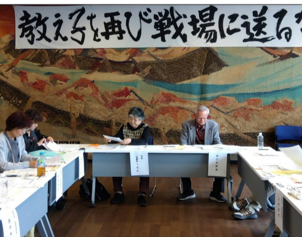
教職員生活を送る